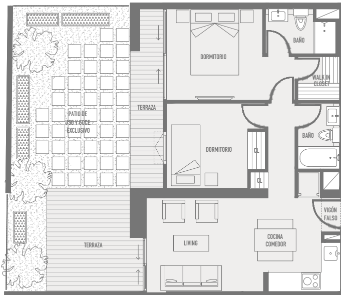
Departamento Base / Tipo E1