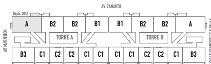
*Plano corresponde a Depto. 201A