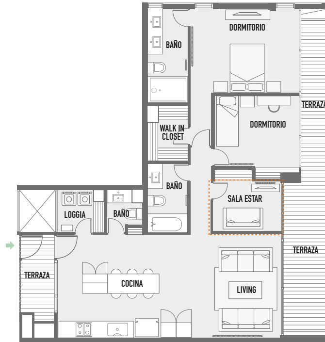
Departamento Base / Tipo A