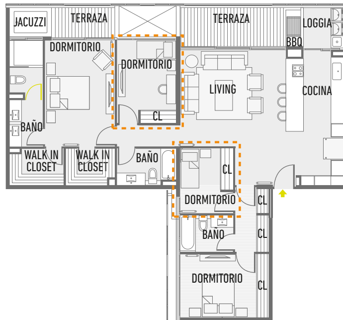
Departamento Base 2º Piso - 6º Piso